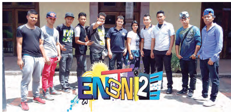
Jóvenes talentos y deportistas son apoyados por EntretenidosHN.

Actualmente cuentan con: grupos coreográficos, cantantes de todo género, estatuas humanas, freshtyler, zanqueros, malabaristas todos ellos jóvenes que a través de su arte enseñan que todo es posible con amor y dedicación.