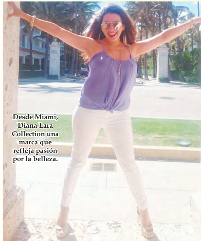
Desde Miami, Diana Lara Collection una marca que refleja pasión por la belleza.

En estas vacaciones de verano se presentaron grandes show en las playas de Honduras, entre ellos Jowell y Randy y Plan B, quienes arrasaron con sus presentaciones. Los eventos fueron presentados por la radio juvenil número uno La Top 107.7 en un ambiente lleno de buena animación y música.