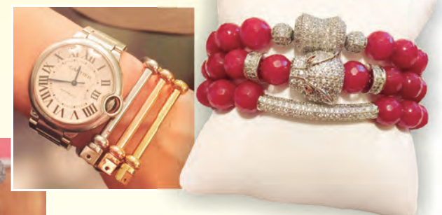
Su estilo único es representado en cada una de las hermosas joyas y accesorios que diseña.