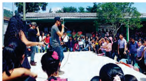
Los talentos de los chicos son proyectados a través de eventos gratuitos en todo el país.