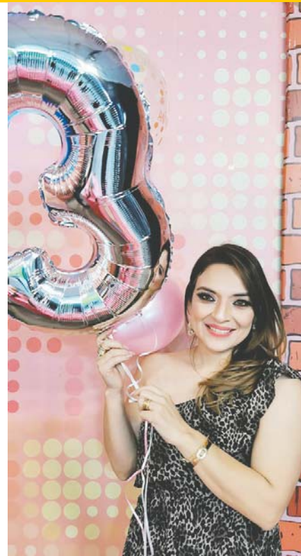
Delmar compartió con televidentes y amigos los éxitos del tercer aniversario de TV Magazine.