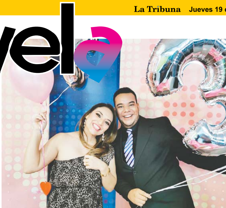
Los chicos celebraron felices el aniversario de TV Magazine.