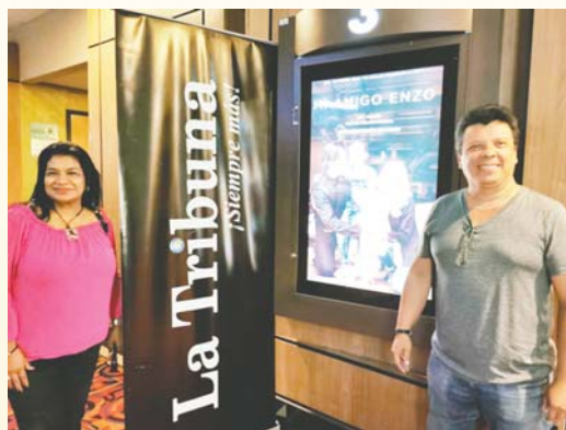
Nuestros lectores disfrutaron de esta espectacular película.