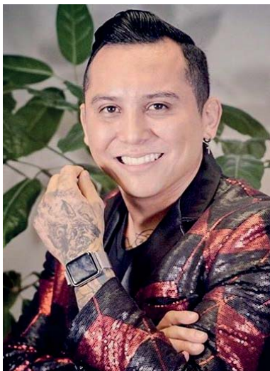
EDWIN LUNA este domingo en VIVELA NOCHE

Además, les traemos las notas del espectáculo que están dando que hablar, así que relájate de tanto estrés y a distraerte con Vivela.