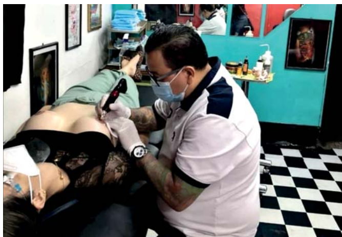
Status Tatto es un negocio comprometido en ayudar año con año a mujeres sobrevivientes de cáncer que desean lucir y sentirse mejor.

H ace 5 años Status Tatto en el marco de la lucha contra el cáncer de mama cada mes de octubre, lleva acabó la campaña "Tatuaje Rosa" en la cual donan tatuajes de areola de seno.