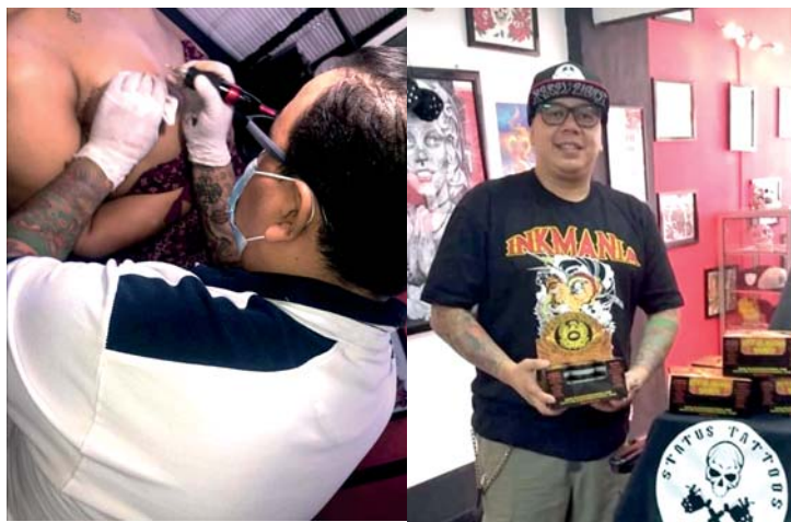
Las mujeres se realizan totalmente gratis su tatuaje de areola de seno.

Sin duda, una gran labor que realiza este negocio de gran renombre en el país por la calidad en su trabajo. Si desean conocer más de ellos o hacer alguna cita para algún trabajo de tatuajes te dejamos el número para citas Whatsapp 8908- 5266 o visítalos en colonia Miramontes frente a la sede del Partido Liberal en Tegucigalpa.