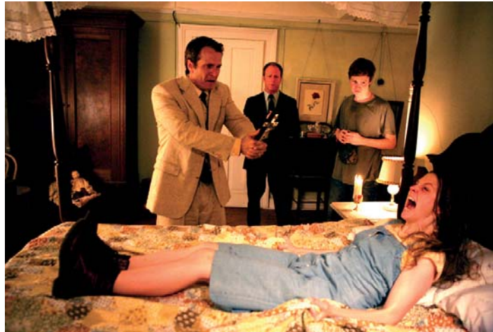
“Proyecto Exorcismo” desde hoy en cines de todo el país.

L lega a la pantalla grande un film que te dejara con los pelos de punta, “Proyecto Exorcismo” donde un juego y burla se vuelve realidad.