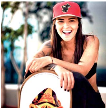
La bella venezolana nos confesó que es pansexual y que actualmente esta soltera.