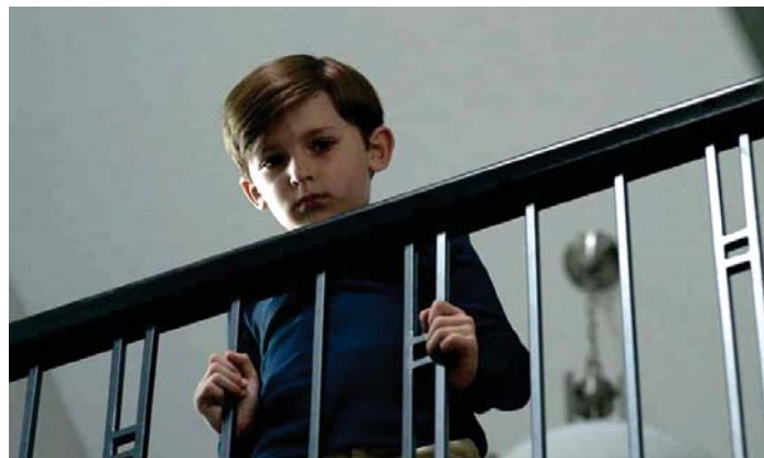
Un film que puedes disfrutar desde hoy en tu cine favorito.