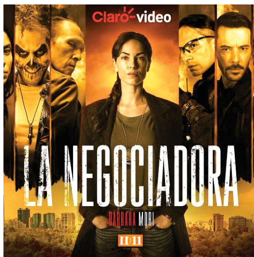
“La Negociadora” te atrapara desde el primer capítulo, disfrútala por Claro Video.

Los usuarios de Claro video podrán disfrutar de “La Negociadora”, además de miles de títulos en diversos géneros como series, películas y documentales, ingresando a www.clarovideo.com desde cualquier navegador web o en las apps de teléfonos o tablets Android, iOS, Huawei y Windows, Smart Tvs, Apple Tv y Chromecast o a través del Claro player.